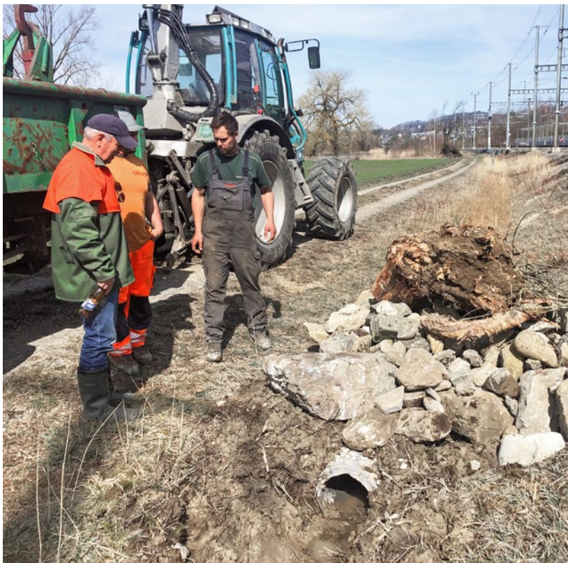
Diese Kleinstruktur über einem Entwässerungsgraben gegenüber dem Bahnhof Bonstetten/Wettswil ist ein Beispiel für die ökologische Aufwertung zur Förderung von Reptilien.