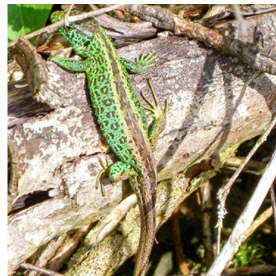
In Holz- und Krautstrukturen können sich Zauneidechsen sonnen, verstecken und Nahrung suchen.

Was die Projektleiter daher ganz besonders freut: Das Projekt wird nun im Kanton Zug weitergeführt – damit sich die Reptilien und andere Tiere weiter von Knonau bis nach Zug besser bewegen und vernetzen können.