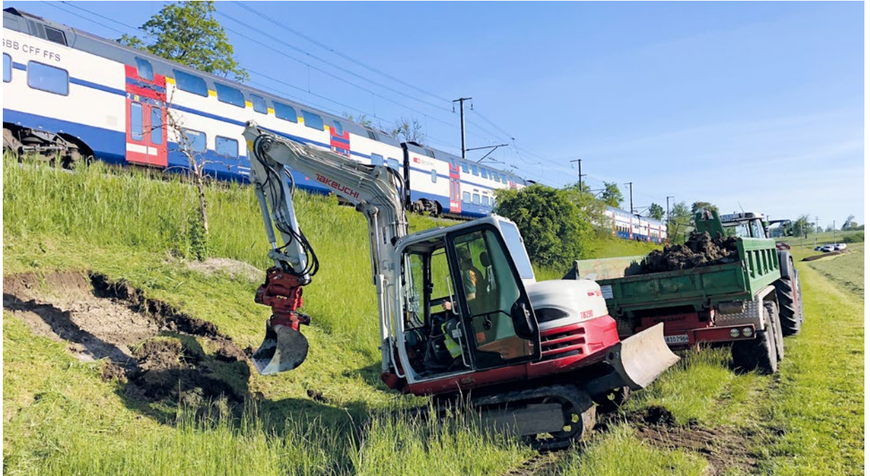
In Bonstetten kam bei der Erstellung von Kleinstrukturen auch der Bagger zum Einsatz.

Reptilien und anderen Tieren als Verstecke und als Plätze zum Schlafen oder zur Eiablage dienen (Foto Seite 26). So schichteten die Freiwilligen zum Beispiel 36 Asthaufen und 17 Steinhaufen auf, platzierten 24 Wurzelstöcke und 4 Steinkörbe. Auch einfache Massnahmen können viel bewirken: 300 Holzbretter, die entlang der Gleise ausgelegt wurden, dienen nun den Kleintieren als willkommene Verstecke und Sonnenplätze.